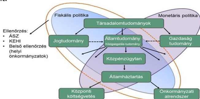
2. ábra: A magyar állampénzügyi modell 33

nemzetgazdaságtant, az e-governmentet, a közigazgatás managementet, a közszolgálati kommunikációt, továbbá a közszolgálati hivatásrendek tudomány-szakterületeit. 32